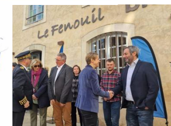
Le Logo Info Origine